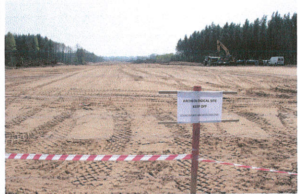
Fot. 14. Niedrzew II st. 20, gm. Strzelce. Tabliczka informacyjna przy stanowisku archeologicznym. Widok od strony północnej.