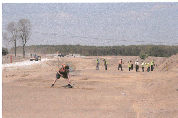
Fot. 3. Beszyn stan. 7, gm. Lubień Kujawski. Widok od strony południowej.