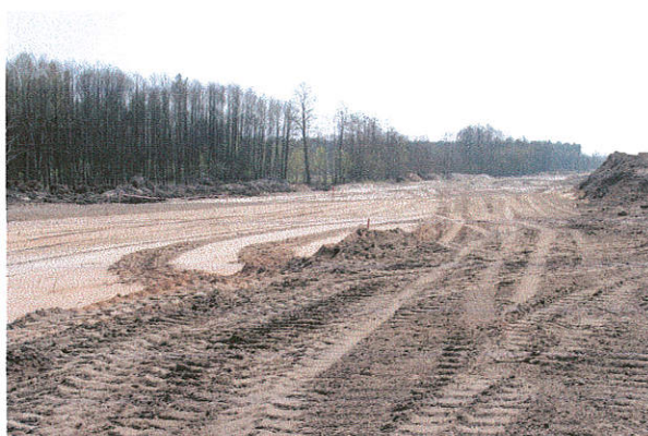
Fot. 15. Niedrzew II st. 20, gm. Strzelce Stanowisko archeologiczne. Widok od strony północno-zachodniej.