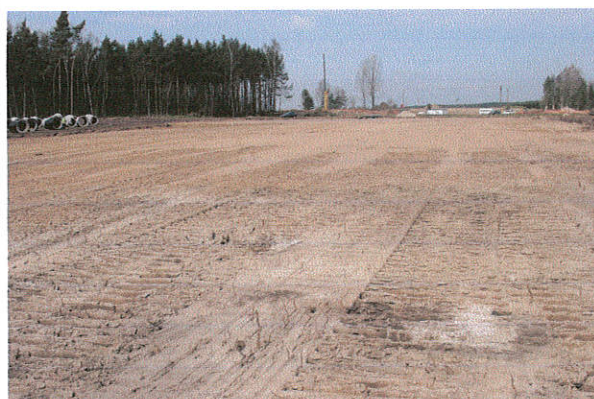
Fot. 17. Niedrzew II st. 20, gm. Strzelce Stropy obiektów archeologicznych. Widok od strony południowej