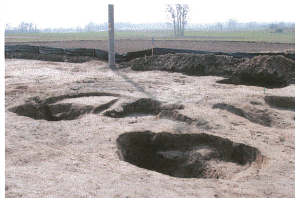
Fot. 6. Dąbrówka stan. 14, gm. Kowal. Negatywy po wyeksplorowanych obiektach archeologicznych. Widok od strony północnej.