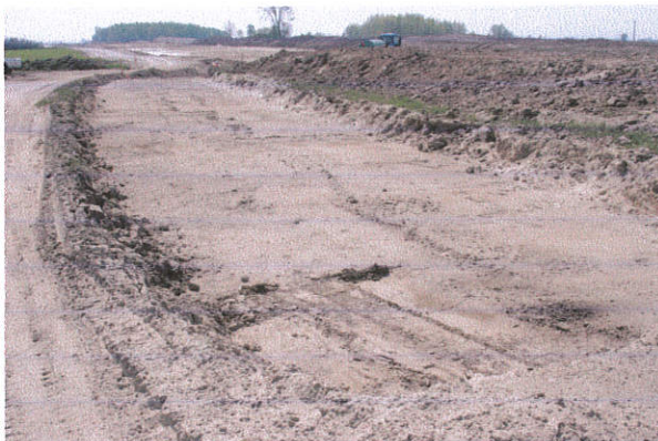
Fot. 9. Działkowo, gm. Lubień Kujawski. Stanowisko archeologiczne. Widok od strony zachodniej.