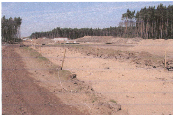
Fot. 11. Niedrzew II st. 5, gm. Strzelce. Fragment odhumusowanej drogi technologicznej z obiektami archeologicznymi. Widok od strony południowej.