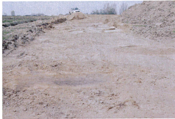
Fot. 20. Jastrzębia st. 2, gm. Gostynin. Stanowisko archeologiczne po odkryciu. Na powierzchni widoczne są stropy obiektów. Widok od strony południowej.