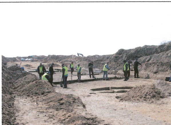
Fot. 1. Beszyn stan. 7, gm. Lubień Kujawski. Badania archeologiczne. Widok od strony południowo-zachodniej.