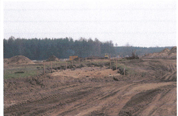
Fot. 12. Niedrzew II st. 5, gm. Strzelce. Fragment odhumusowanej drogi technologicznej z obiektami archeologicznymi. Widok od strony północnej.