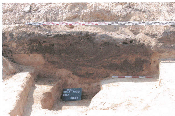
Fot. 2. Beszyn stan. 7, gm. Lubień Kujawski. Profil obiektu archeologicznego.