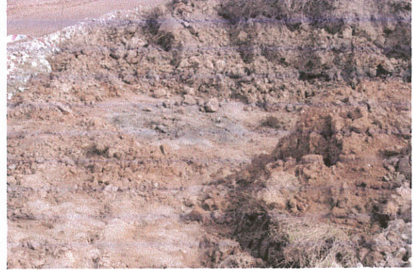
Fot. 8. Dąbrówka, gm. Kowal. Obiekt archeologiczny odsłonięty w pasie drogi technologicznej (km 216+399). Widok od strony południowo-zachodniej.