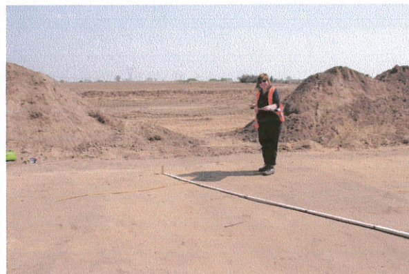
Fot. 4. Beszyn stan. 7, gm. Lubień Kujawski. Dokumentacja obiektu archeologicznego.