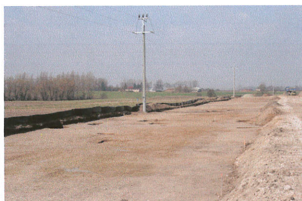
Fot. 5. Dąbrówka stan. 14, gm. Kowal. Stanowisko archeologiczne po zakończeniu badań. Widok od strony wschodniej.