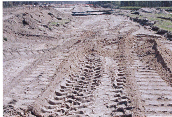
Fot. 22. Jastrzębia st. 2, gm. Gostynin. Stanowisko archeologiczne z widocznymi zniszczeniami jego powierzchni. Widok od strony północnej.