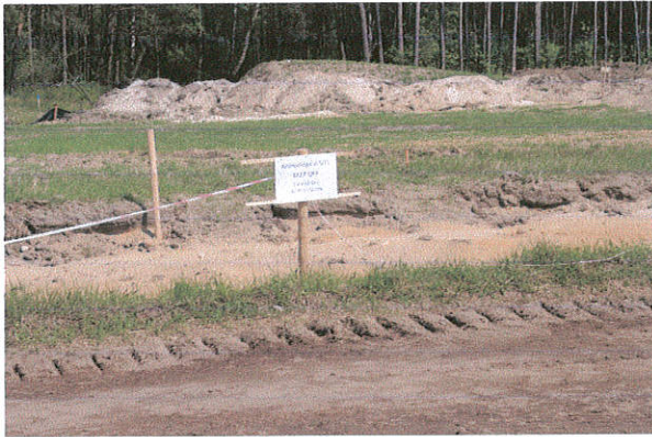
Fot. 13. Niedrzew II st. 5, gm. Strzelce. Tabliczka informacyjna przy stanowisku archeologicznym.