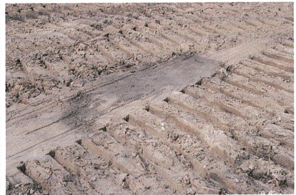
Fot. 16. Niedrzew st. 20, gm. Strzelce Strop obiektu archeologicznego.