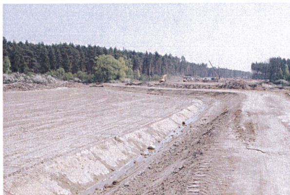
Fot. 21. Jastrzębia st. 2, gm. Gostynin. Stanowisko archeologiczne. Widok od strony północnej.