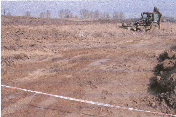
Fot. 7. Dąbrówka, gm. Kowal. Obiekt archeologiczny odsłonięty w pasie drogi technologicznej (km 216+411). Widok od strony południowo-zachodniej.