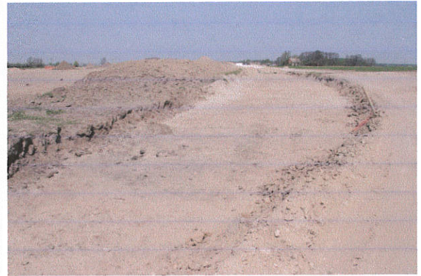
Fot. 10. Działkowo, gm. Lubień Kujawski. Stanowisko archeologiczne. Widok od strony wschodniej.