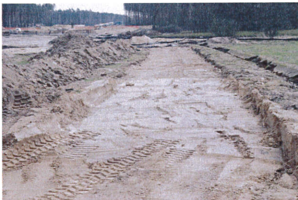
Fot. 19. Jastrzębia st. 2, gm. Gostynin. Stanowisko archeologiczne po odkryciu. Na powierzchni widoczne są stropy obiektów. Widok od strony północnej.